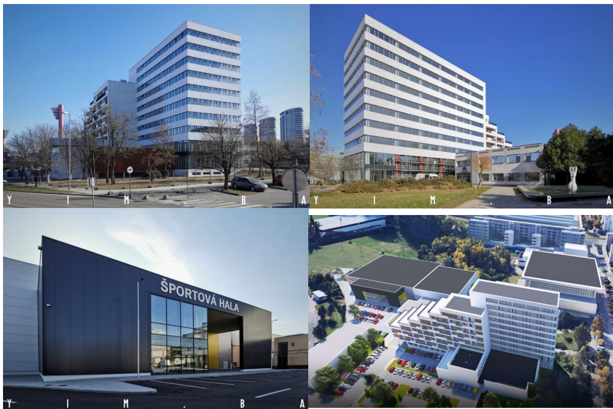
Obrázky č.1-4 Domu športu

Prestavba bývalého hotelu Dom športu je prakticky dokončená. Budova s charakteristickým tvarom, dotvárajúca centrum mestskej časti Nové Mesto, ako aj športovú lokalitu Pasienkov, bola v prestavbe od roku 2019. Dobudovanie sa omeškalo, dnes sa však zdá, že na objekte prebiehajú posledné práce. Nachádzať sa tu budú apartmány, kancelárie aj nová športová hala.